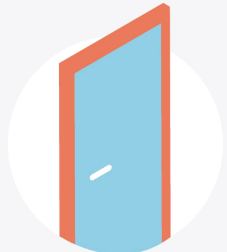
12 Pequeño almacén

¿Necesitas asesoramiento para iniciar tu negocio Cold Press?