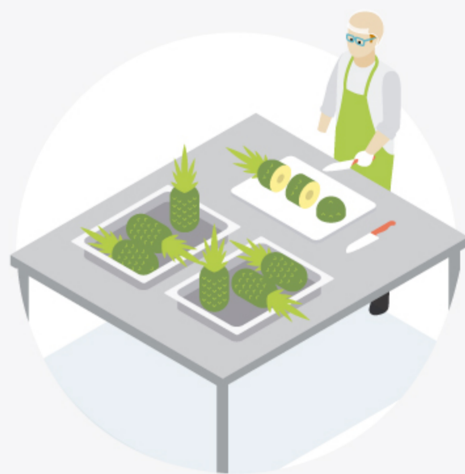
6 Mesas para lavado y preparación de frutas