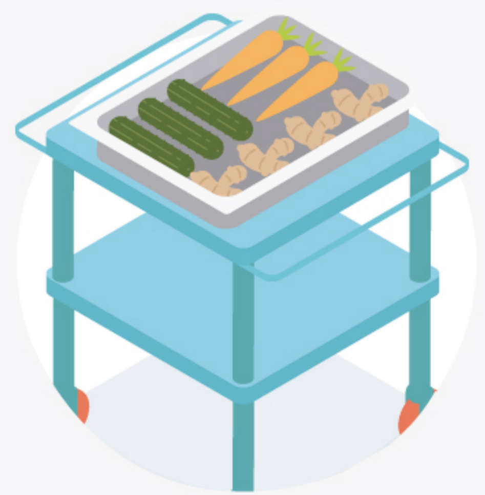
9 Mesa o carro de apoyo con ruedas