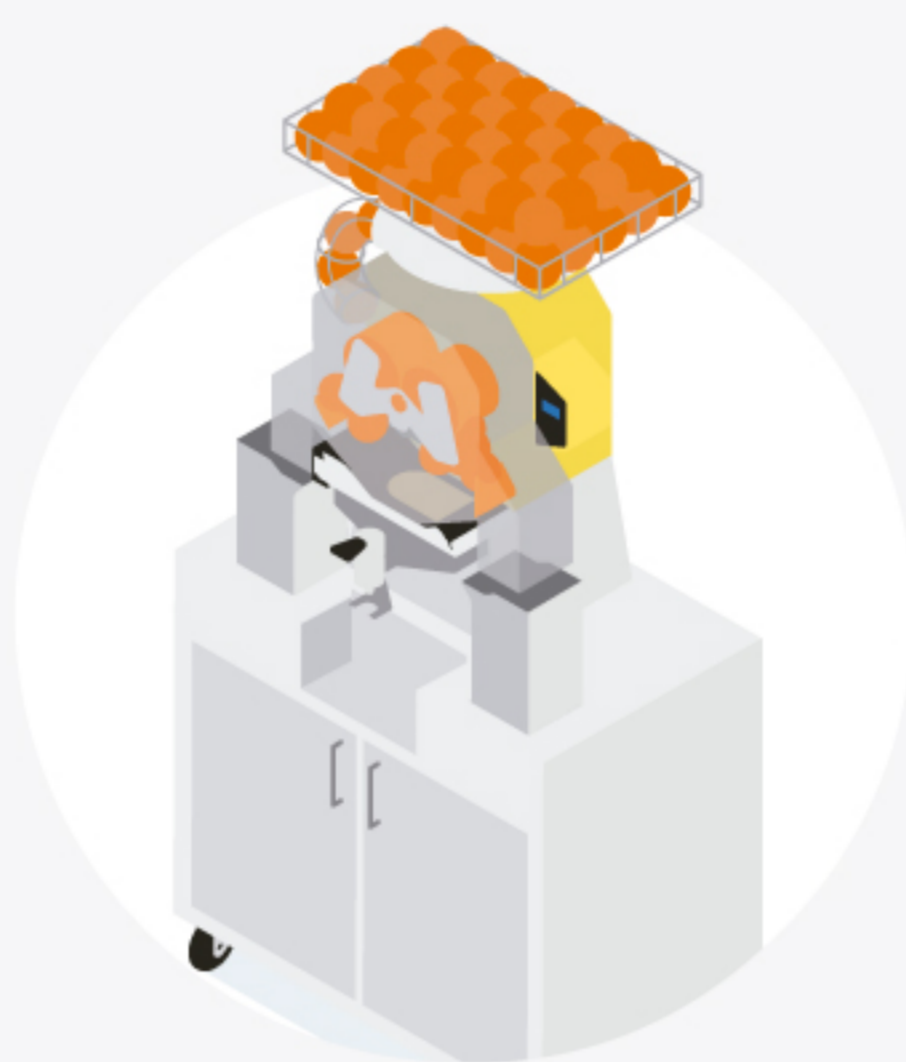
2 Exprimidor de cítricos o exprimidores industriales