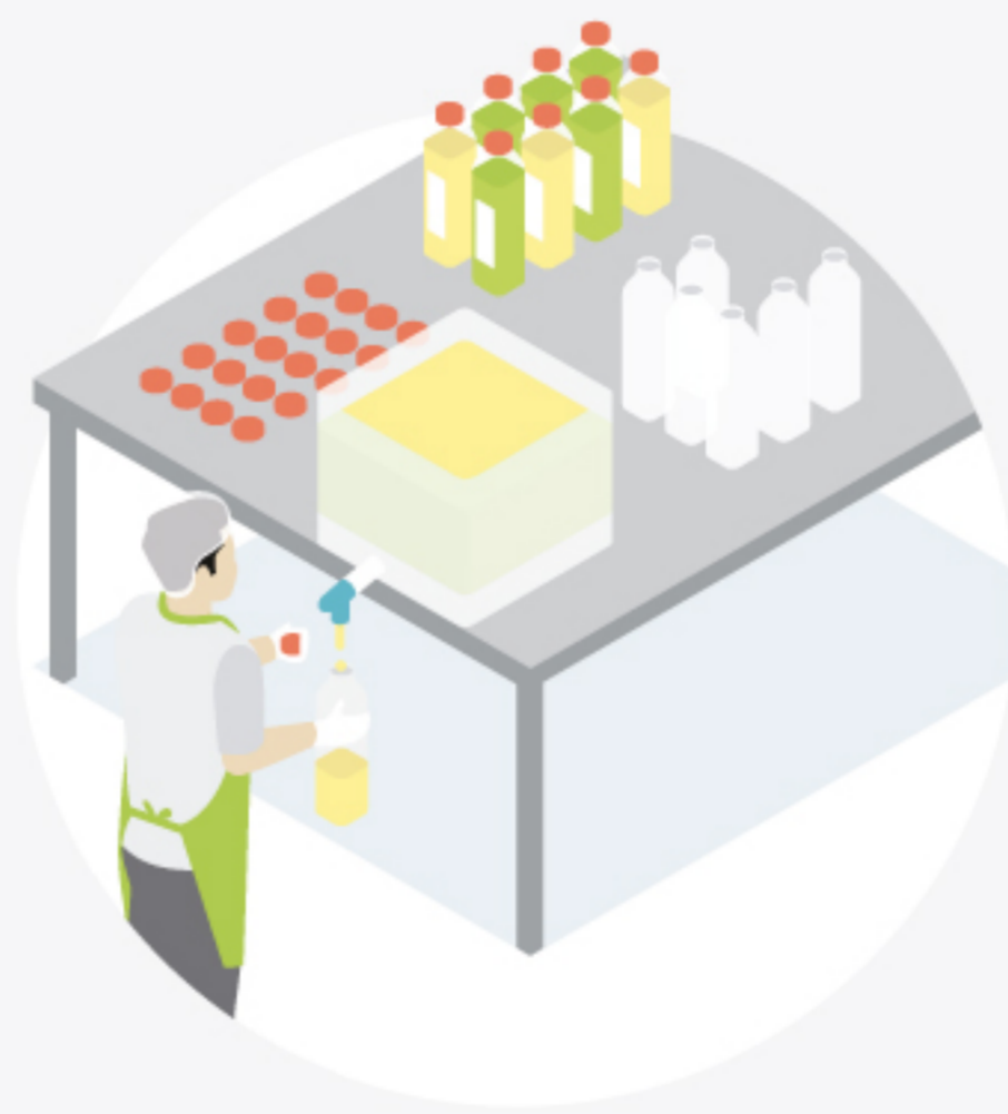
8 Mesas para llenado de botellas y taponado manual