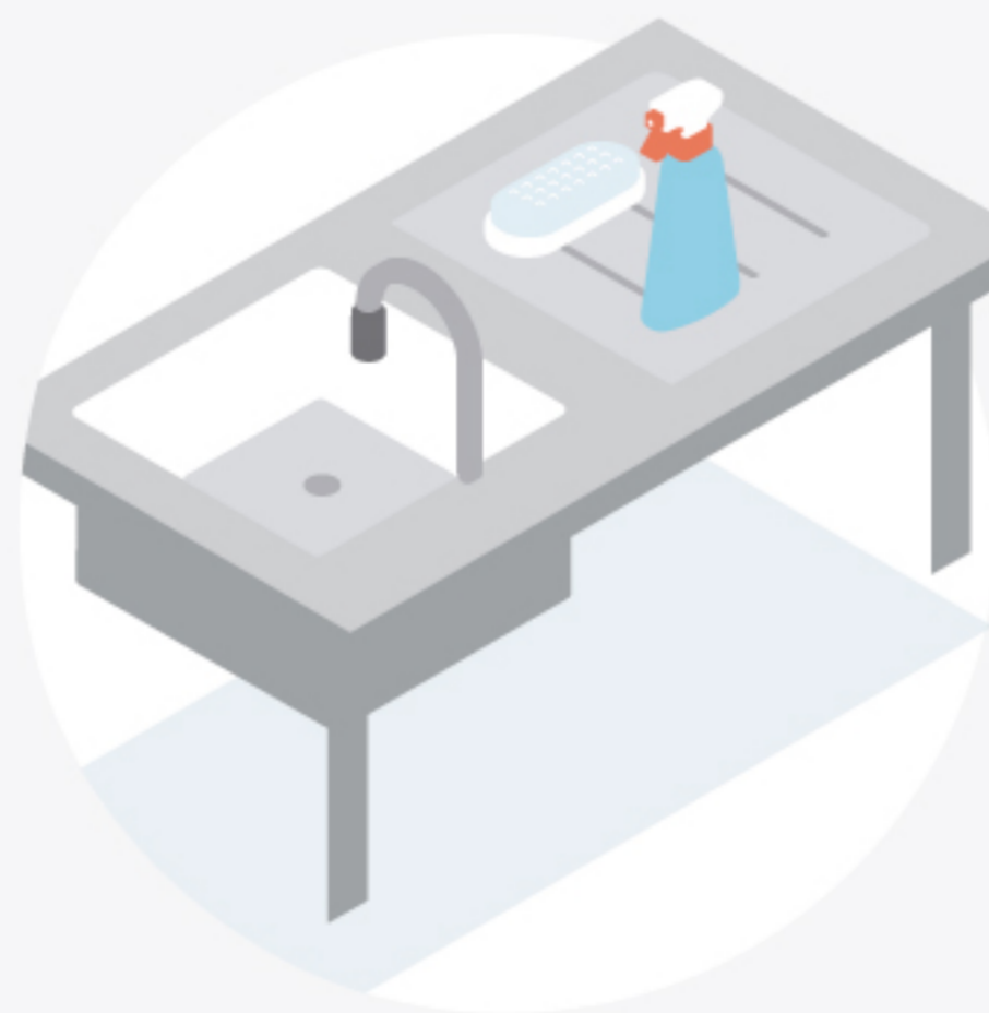
11 Instalación de agua caliente a presión