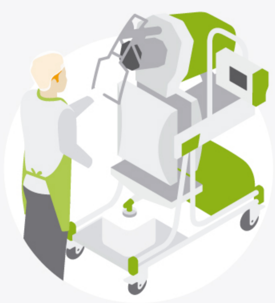
1 Máquina Cold Press o extractor de prensado en frío