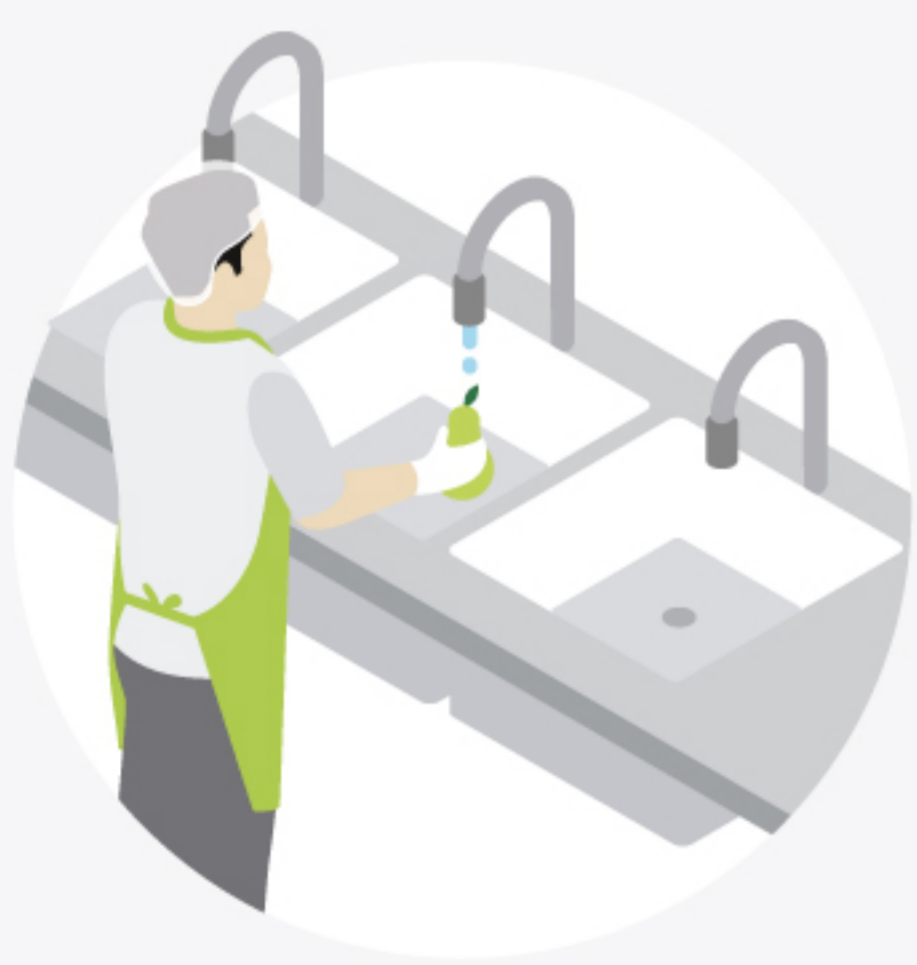
7 Punto de lavado con tres senos donde limpiar la fruta y la verdura